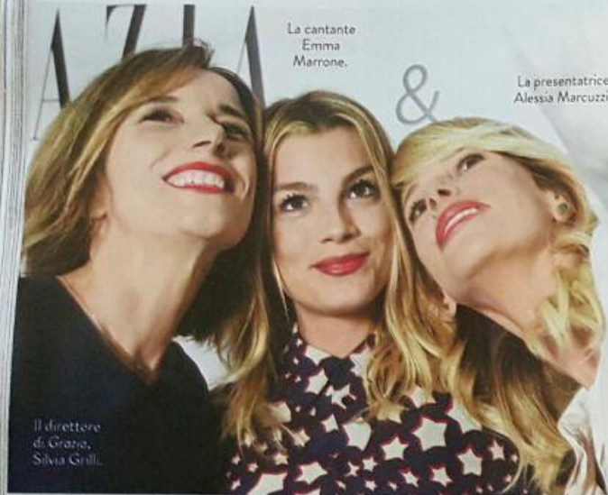
La cantante Emma Marrone.