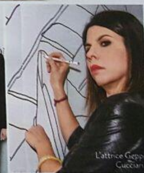
L'attrice Geppi Cucciari.