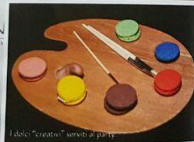
I dolci "creativi" serviti al party