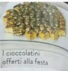
I cioccolatini offerti alla festa